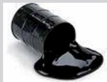
Baril de pétrole

Pays producteurs de pétrole créée le 19.9.1960 qui a son siège à Vienne, en Autriche. Les 3 premiers producteurs mondiaux sont : L'Arabie saoudite, les Etats Unis d'Amérique et la Russie. Les 4 premiers producteurs africains sont : le Nigéria, l'Algérie, la Lybie et l'Angola.