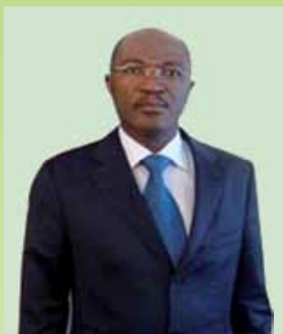
Les ministres en charge du Budget, de l'Économie, des Mines et du Pétrole, ont reçu tour à tour le Groupe d'Intérêt EITI Gabon